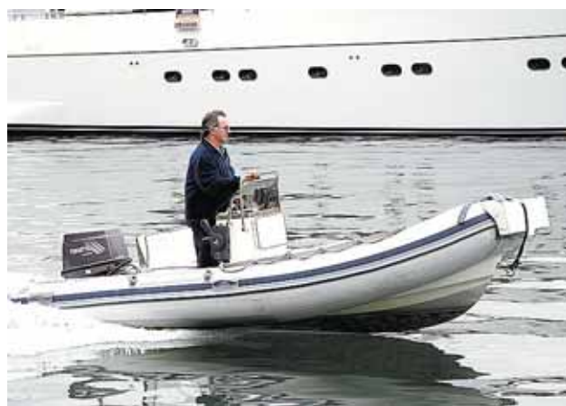
Los mejores profesionales deliberarán sobre el universo marítimo.

En el congreso estarán presentes ponentes de España, Italia, Francia, Bélgica, Alemania y Chipre, Túnez, Grecia, Turquía y Emiratos Árabes. A su vez, se darán cita en Palma representantes de la Comisión Europea y diferentes profesionales de veinte países.