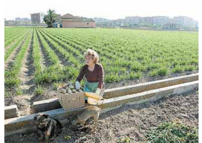
Las obras afectan a una superficie superior a las 1.700 hectáreas

El presidente del Govern, Jaume Matas, presidirá el acto inaugural del congreso. Aprovechará la ocasión para presentar el proyecto 'Odyssea, puertos territorios y culturas: una visión de futuro que integra el mar, los puertos y el territorio'.